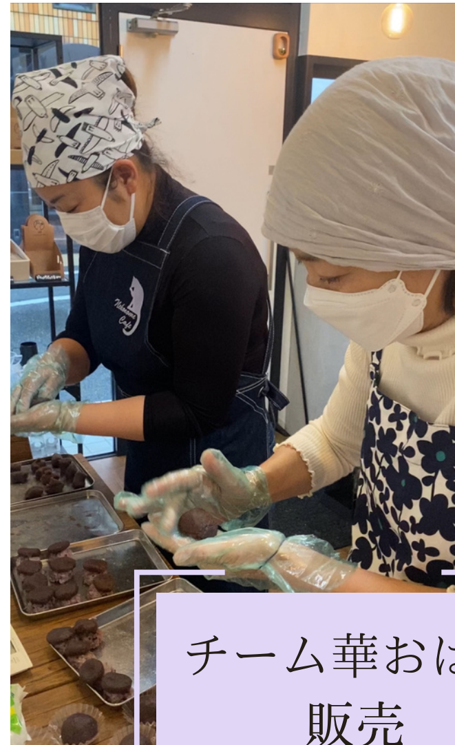
チーム華おはぎ 販売